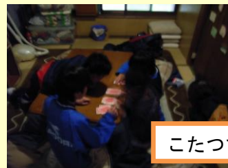
こたつで和んでいます